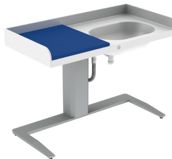
343 - mit Babywanne